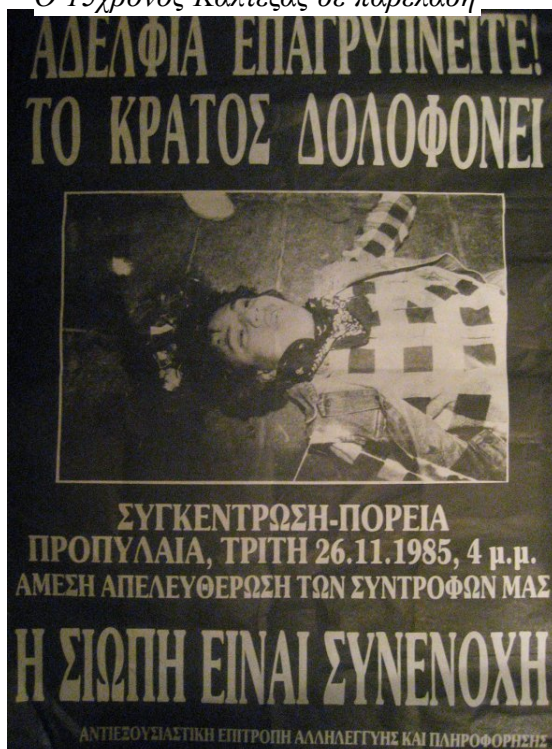
Αφίσα για την συγκέντρωση-πορεία