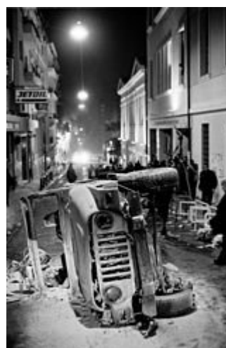
9 Δεκεμβρίου 2008: Καταστροφές στην οδό Σίνα δίπλα από την Νομική Αθηνών

Ο Πρόεδρος της Δημοκρατίας παρέμεινε στο φρουρούμενο προεδρικό μέγαρο για λόγους ασφαλείας μετά τα αλληπάλληλα χτυπήματα της ιδιωτικής του κατοικίας στην Αθήνα. Δηλώσεις έκανε και ο δήμαρχος της Αθήνας Νικήτας Κακλαμάνης για το πλήγμα που δέχθηκε η χώρα στον πυρήνα του οικονομικού της βίου σε μια δύσκολη στιγμή, ενώ υποσχέθηκε την έμπρακτη συμπαράστασή του.