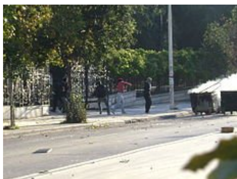
Επεισόδια έξω από το Αριστοτέλειο Πανεπιστήμιο Θεσσαλονίκης

Την επομένη ημέρα από το περιστατικό, διοργανώθηκαν πορείες πολιτών, οι οποίοι επιθυμούσαν να εκδηλώσουν τη δυσαρέσκειά τους απέναντι στη γενικότερη στάση του κρατικού μηχανισμού και στον τρόπο λειτουργίας της Ελληνικής Αστυνομίας, έπειτα από συσσώρευση παρόμοιων περιστατικών και καταγγελιών αστυνομικής βίας. Οι πορείες έλαβαν χώρα, παράλληλα με τις επιθέσεις διαφόρων επιθετικών ομάδων, οι οποίες συνέχισαν τις εκδηλώσεις βίας με αυξανόμενη ένταση. Στο κέντρο της Αθήνας σημειώθηκαν καταστροφές σε πολυκαταστήματα, αυτοκίνητα και τράπεζες..