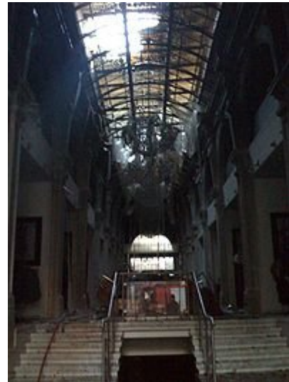
Ολοσχερής καταστροφή νεοκλασικού κτηρίου το οποίο στέγαζε πολυκατάστημα στην οδό Ερμού, στην Αθήνα.

συμβεί τον υπουργό Εσωτερικών και τον αρχηγό της αστυνομίας, δηλώνοντας πως δεν προτίθεται να παραιτηθεί από την υπόθεση. Δήλωσε δε την πρόθεσή του να υποβάλει αίτηση για αποφυλάκιση των κατηγορουμένων στο προσεχές μέλλον, πυροδοτώντας νέες αντιδράσεις. Ο φίλος του Αλεξάνδρου που γιόρταζε την ονομαστική του εορτή ήταν παρών στο περιστατικό και έσπευσε να δώσει τη μαρτυρία του στους δικαστικούς λειτουργούς όταν εκλήθη, ενισχύοντας τις ήδη δημοσιοποιηθείσες μαρτυρίες περιοίκων και περαστικών.