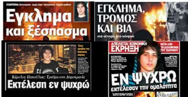
Τίτλοι από πρωτοσέλιδα Αθηναϊκών εφημερίδων της 8/12/2008

Η πληροφορία του θανάτου του μαθητή διαδόθηκε άμεσα σε ολόκληρη την Ελλάδα από το Διαδίκτυο και τα Μέσα Μαζικής Ενημέρωσης, κάτι που είχε ως αποτέλεσμα άτομα από διάφορους πολιτικούς χώρους να εκδηλώσουν την οργή τους στα μεγάλα αστικά κέντρα ταυτόχρονα, προκαλώντας φθορές και εμπρησμούς. Οι εκδηλώσεις βίας μετατοπίστηκαν από το Πολυτεχνείο στο Νοσοκομείο Ευαγγελισμός, όπου διακομίστηκε ο άτυχος νεαρός και όπου απλώς διαπιστώθηκε ο θάνατός του.