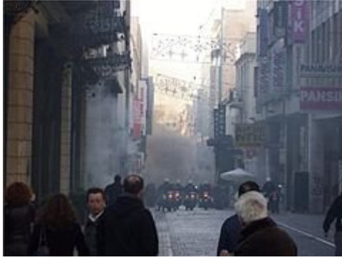
Ταραχές στην οδό Ερμού, Αθήνα