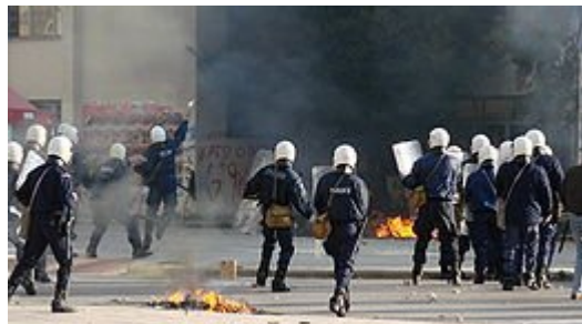
Αστυνομικές δυνάμεις έξω από τη Νομική Σχολή του Δημοκρίτειου Πανεπιστημίου Θράκης στην Κομοτηνή.

Τις ίδιες ώρες διοργανώθηκαν παρόμοιες εκδηλώσεις και σε άλλες πόλεις της Ελλάδας, όπως στη Θεσσαλονίκη, τη Λάρισα, την Πάτρα, την Κρήτη και άλλες περιοχές της ελληνικής περιφέρειας, που σε αρκετές περιπτώσεις συνοδεύτηκαν από επεισόδια. Το βράδυ πυρπολήθηκε το Αστυνομικό Τμήμα Συκεών, ενώ τραυματίστηκε βαριά αστυνομικός φρουρός.