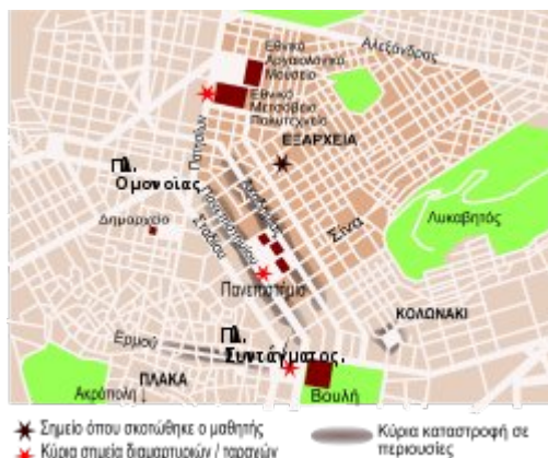
Ακτίνα διαδηλώσεων και καταστροφών στην Αθήνα.

συγκεντρωμένους «επιδοκίμασε τη θανάτωση προσώπου», ενώ για τον δεύτερο κατηγορούμενο «η συμπεριφορά του δεν υπολείπεται σε ποινική απαξία», καθώς δεν απέτρεψε τον συνάδελφό του και ταυτόχρονα συμμετείχε «στις αντεγκλήσεις και στην ανταλλαγή ύβρων» επιδεικνύοντας ταυτόχρονα «χαρακτηριστική στάση ετοιμότητας και επίδειξης ισχύος». Η δίκη της υπόθεσης ορίστηκε για τις 15 Δεκεμβρίου 2009 στο Μικτό Ορκωτό Δικαστήριο Χαλκίδας, καθώς υπήρχε η άποψη πως μια δίκη στην Αθήνα θα προκαλούσε νέες καταστροφές στην πόλη. Μετά από ενστάσεις φορέων της πόλης της Χαλκίδας, για τον φόβο επεισοδίων, το ποινικό τμήμα του Αρείου Πάγου παρέπεμψε την υπόθεση στο Μικτό