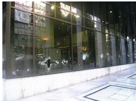
Εκατοντάδες καταστήματα και τράπεζες στο κέντρο της Αθήνας καταστράφηκαν ή υπέστησαν ζημιές

Εκτός Ελλάδας, επεισόδια έγιναν και στη Λευκωσία, όπως επίσης και την Πάφο στις 8 Δεκεμβρίου. Συμβολικές καταλήψεις πραγματοποιήθηκαν από νεαρούς επίσης στην ελληνική πρεσβεία στο Λονδίνο και διαμαρτυρίες στα προξενία του Βερολίνου, της Φλωρεντίας της Μπολόνια και του Τορίνο, καθώς και στο Ελληνικό Ινστιτούτο Βυζαντινών και Μεταβυζαντινών Σπουδών στη Βενετία, ενώ μικρές φθορές προκλήθηκαν στα προξενία της Νέας Υόρκης και της Κωνσταντινούπολης.