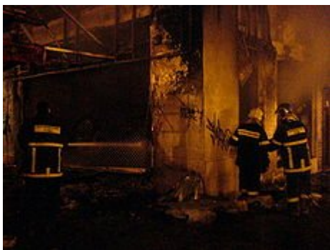
Ληλατημένο και καμένο κατάστημα κινητής τηλεφωνίας στην Θεσσαλονίκη.

Αστυνομικοί της Ομάδας Ζ πυροβόλησαν πολλές φορές στον αέρα.