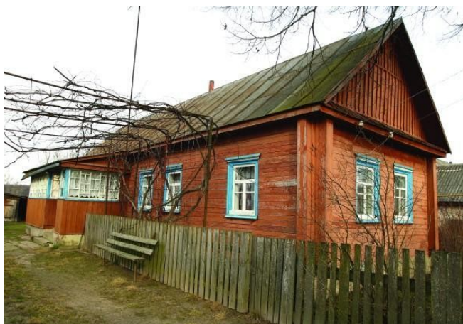
Το πατρικό του σπίτι όπου μεγάλωσε